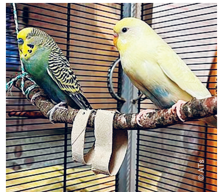
Inaya und Mango

Informieren Sie sich über die Bedürfnisse der Tiere und die gesetzlichen Vorschriften. Mit dem neuen Tierhaltungsrechner geht dies nun ganz einfach: www.tierhaltungsrechner.ch .